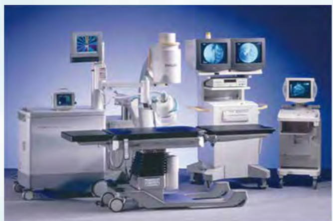
体外衝撃波結石破砕装置