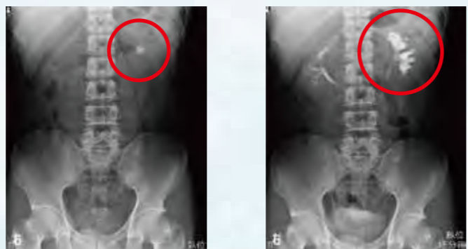
単純X線写真：大きな左腎結石 造影検査：左水腎症の状態