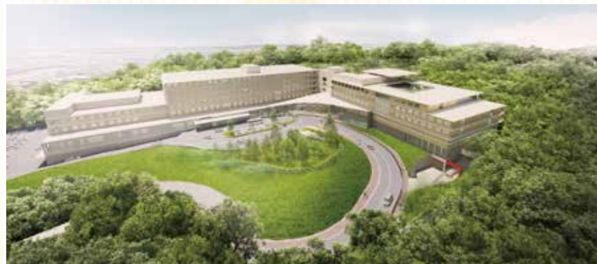
新百合ヶ丘総合病院増床後の外観

さらに屋上にはヘリポートを設け、近隣にはない規模の災害拠点病院を目指します。ヘリコプターの需要はこれからますます高まると考えられます。道路渋滞などで救急車の身動きがとれない場合には、空からのアプローチを活かせるよう救急体制を整えます。増床にともない職員を増員し、スタッフ一丸となって時代のニーズに合わせた病院づくりに全力を尽くします。そして今後もさらなる地域貢献、先進医療、救急医療の充実を目指して邁進してまいります。