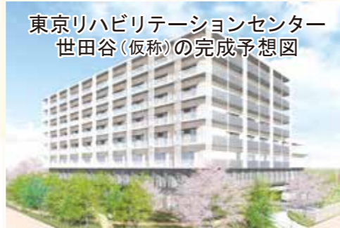
東京リハビリテーションセンター世田谷(仮称)の完成予想図

援施設・障害児ショートステイ(定員98名)、自立訓練(定員20名)、児童発達支援(定員50名)、放課後等デイサービス(定員50名)、通所リハビリテーション(定員80名)、認知症対応型通所介護(定員12名)、療養通所介護(定員9名)、訪問介護、訪問看護、訪問看護ステーション、訪問リハビリテーション、居宅介護支援事業所、定期巡回・臨時対応型訪問看護看護、障害者相談支援事業、在宅サポートセンター等があります。