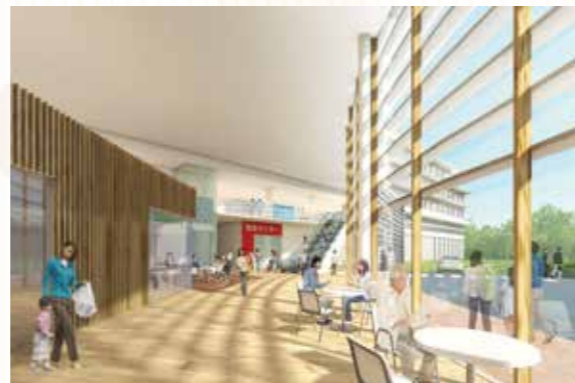
新百合ヶ丘総合病院新棟の内観