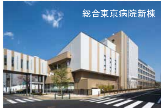
総合東京病院新棟

2017年4月より、これまでのA棟に隣接して新しくB棟が完成し、稼働を開始しました。救急治療センター、脳神経センター、心臓血管センター、リハビリセンターを新たに開設し、最新の設備を整えています。救急医療・急性期医療の提供体制を更に充実させ、地域の中核的急性期医療機関として、また一般病床と回復期リハビリ病棟を兼ね備えた稀有な医療機関として、小児から高齢者まで一貫したサービスを提供することで、今後も地域に貢献していきます。病床数:451床(うち回復期:142床)。救急車の受入れ台数:年間約4,000台。一年後には、循環器専門病院としての認定を目指しています。