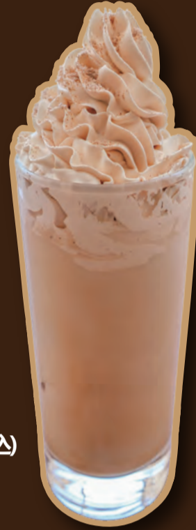
ホイップアイス チャイラテ