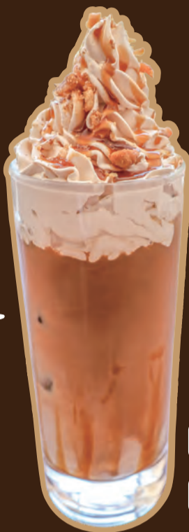
キャラメル ホイップラテ