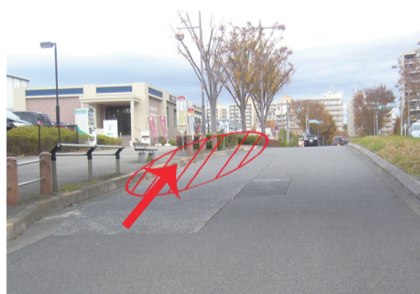
②稲城六中東停車場所