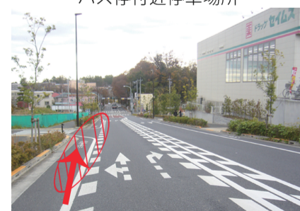
⑥セイムス稲城上平尾店付近 停車場所