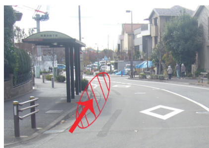
④若葉台四丁目 バス停付近停車場所