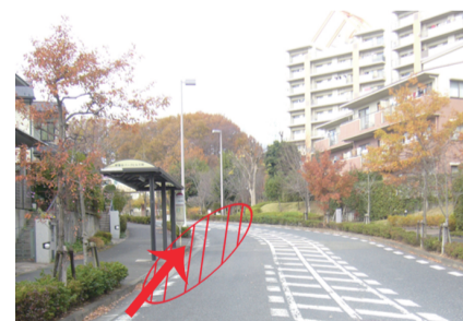
③若葉台パークヒルズ前 バス停付近停車場所